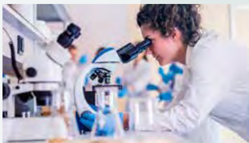
Brand: Greater Copenhagen Region, Campaign: Microbiome