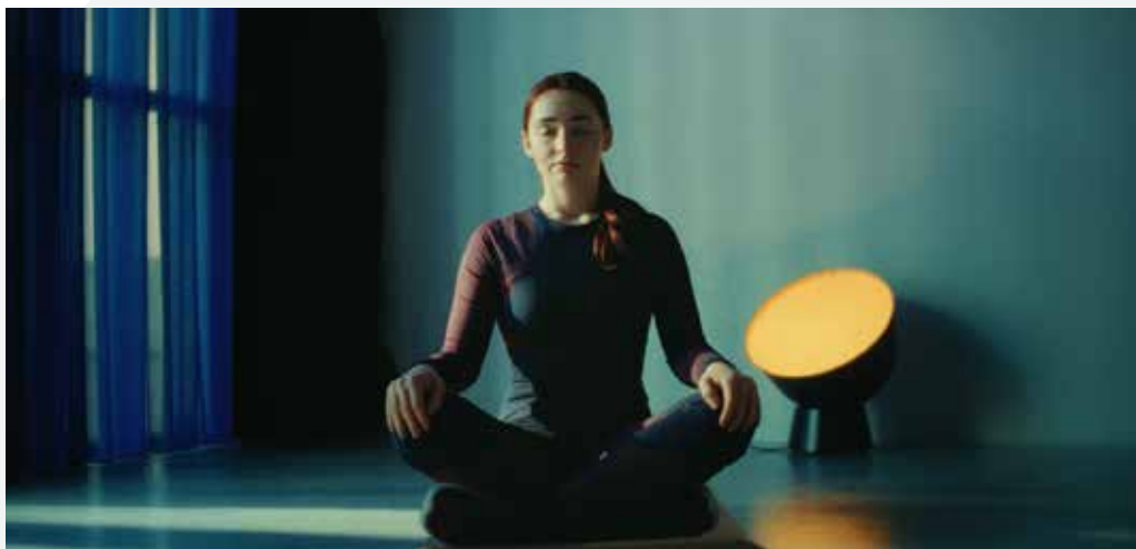
Brand: State Of Denmark, Campaign: Danish Machine