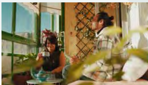
Brand: Greater Copenhagen Region, Campaign: Green Deal