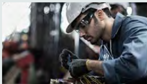
Brand: State Of Denmark, Campaign: Future Generator