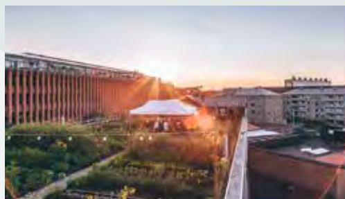
Brand: Copenhagen Capacity, Campaign: Copenhagen is for you