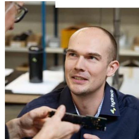
Bliv klar til at ansætte internationale i produktionsvirksomheder