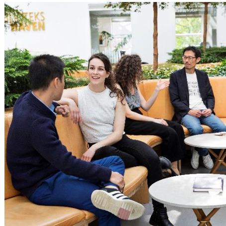
Bliv klar til at ansætte internationale specialister